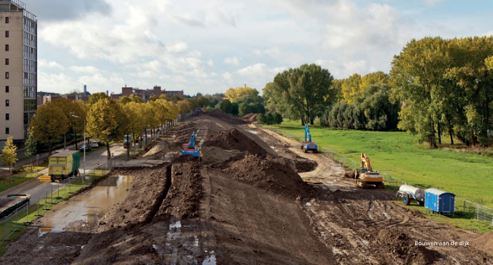
Bouwen aan de dijk